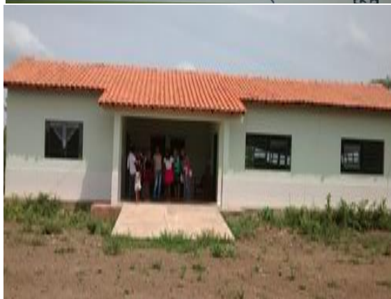
Croqui indicando a localização da comunidade Forte do Castelo.