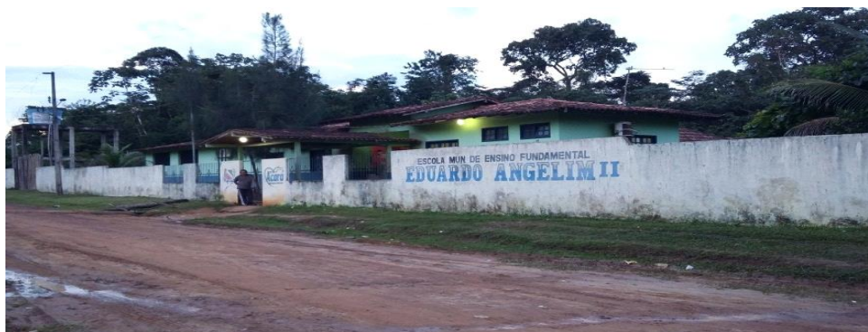
Figura 2 Escola Municipal de Ensino Fundamental Angelim II

Mais precisamente, a escola (figura 2) esta localizada a margem esquerda do rio Acará na localidade Boa Esperança, São Lourenço. Sendo que a mesma se situa a 20 km da sede do Município de Acará-Pará, acessada por ramais e também pelo rio Acará.